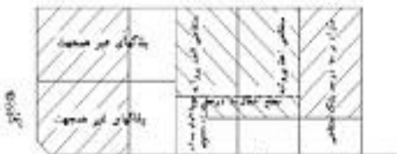
حد اکثر ۲ پلاک بدنه