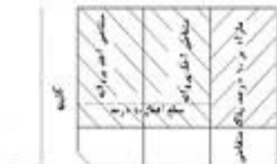
حد اکثر ۲ پلاک بدنه