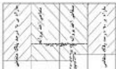
حد اکثر ۲ پلاک بدنه